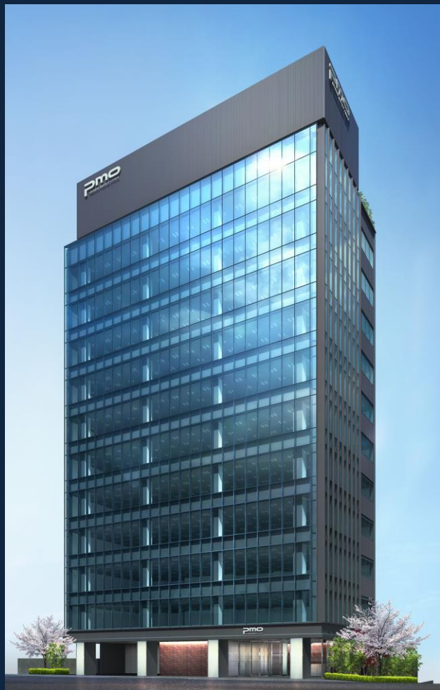
PMO渋谷II 外観完成予想CGパース